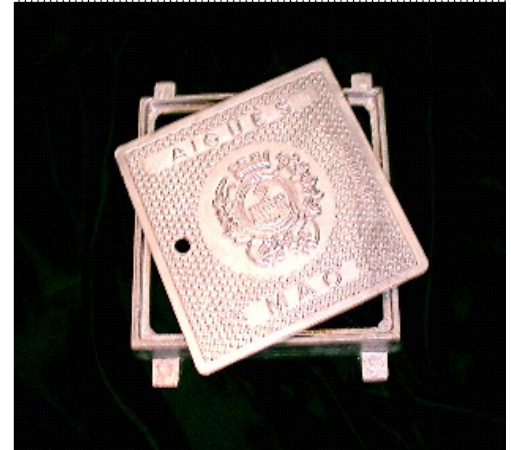
REGISTRO LLAVE DE PASO TAMBIEN PARA: GAS, TELEVISION, TELEFONO, ALUMBRADO, BOCA DE RIEGO, ETC. DIMENSIONES ( 20 X 20 ) Cm.