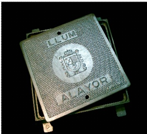
REGISTRO DE ALUMBRADO TAMBIEN PARA: LLAVE DE PASO, GAS, TELEVISIÓN, TELEFONO, BOCA DE RIEGO, ALCANTARILLADO, ETC. DIMENSIONES ( 30 X 30 ) Cm.