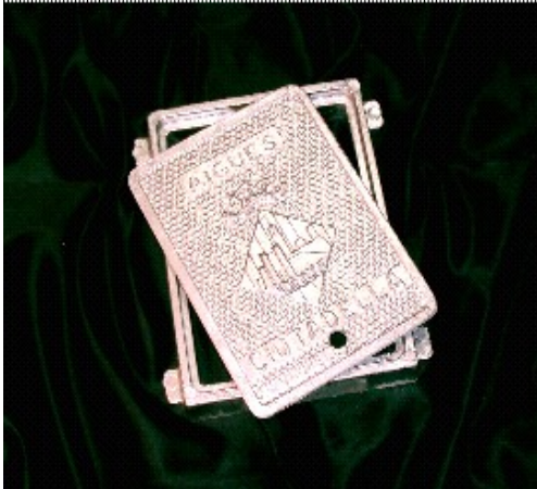
REGISTRO LLAVE DE PASO TAMBIEN PARA: GAS, TELEVISION, TELEFONO, ALUMBRADO, BOCA DE RIEGO, ETC. DIMENSIONES ( 20 X 15 ) Cm.